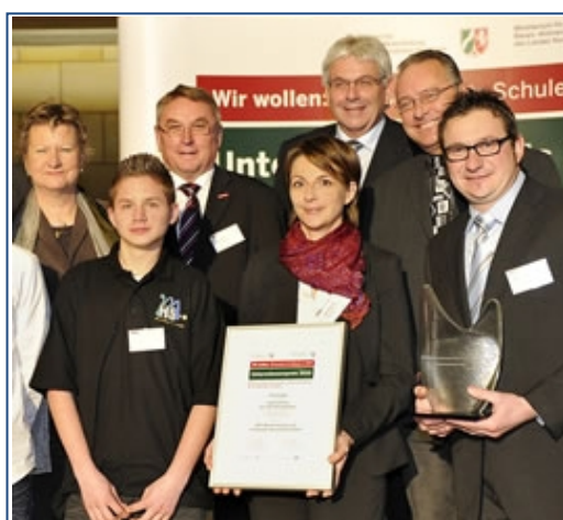
MFT erhält am 29.11.2010 den Unternehmenspreis 2010 für sein Engagement in der Zusammenarbeit mit der Hauptschule Mechernich.