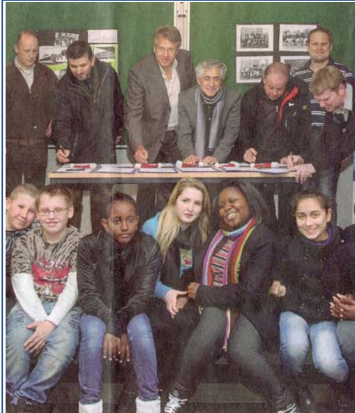
Handwerksbetriebe kooperieren mit der Karl-Simrock-Schule