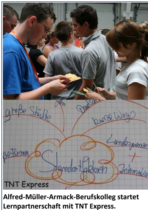
Alfred-Müller-Armack-Berufskolleg startet Lernpartnerschaft mit TNT Express.