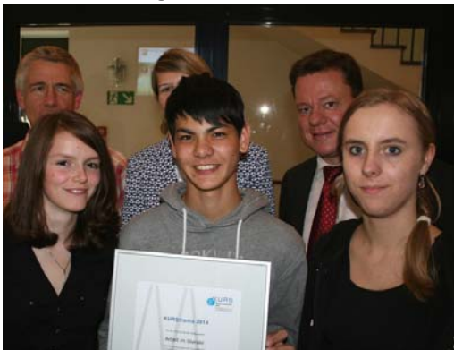
Die Schüler des Lise-Meitner-Gymnasiums freuten sich über ihre Auszeichnung.