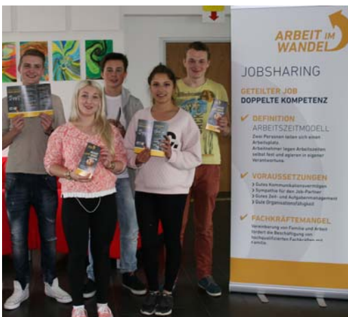
Schüler der Privatschule Conventz mit ihren Produkten zum Thema.