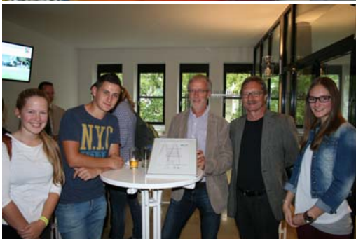
Schüler der Elwin-Christoffel-Realschule im Vorspann zum Filmprojekt und bei der Preisverleihung