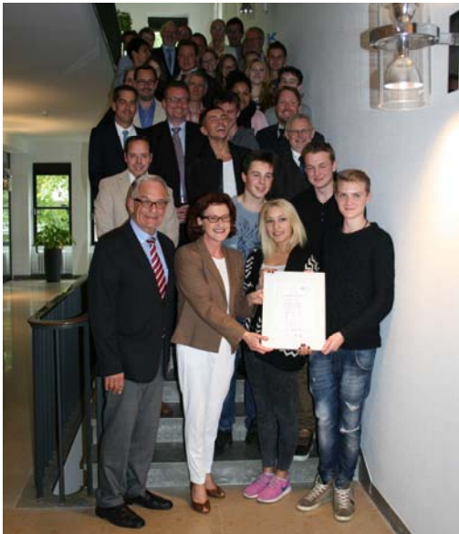
Gruppenbild mit Regierungspräsidentin; Preisverleihung in der Bezirksregierung Köln