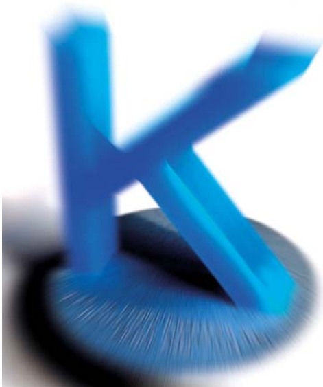
Das große „K“, ein großer Buchstabe aus blauem Acryl auf einem Sockel aus Edelstahl