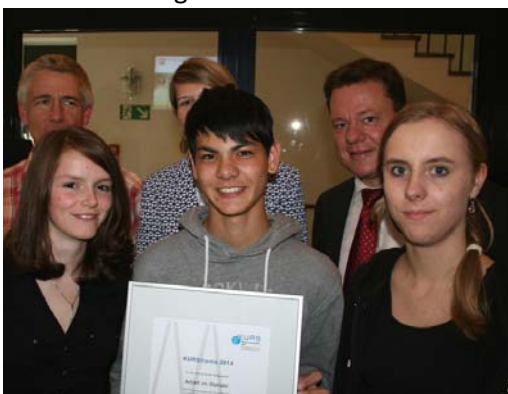
Die Schüler des Lise-Meitner-Gymnasiums freuten sich über ihre Auszeichnung.