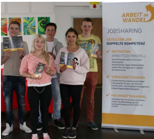
Schüler der Privatschule Conventz mit ihren Produkten zum Thema.