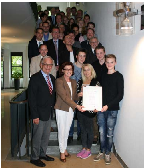
Gruppenbild mit Regierungspräsidentin; Preisverleihung in der Bezirksregierung Köln