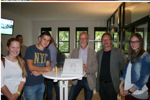
Schüler der Elwin-Christoffel-Realschule im Vorspann zum Filmprojekt und bei der Preisverleihung